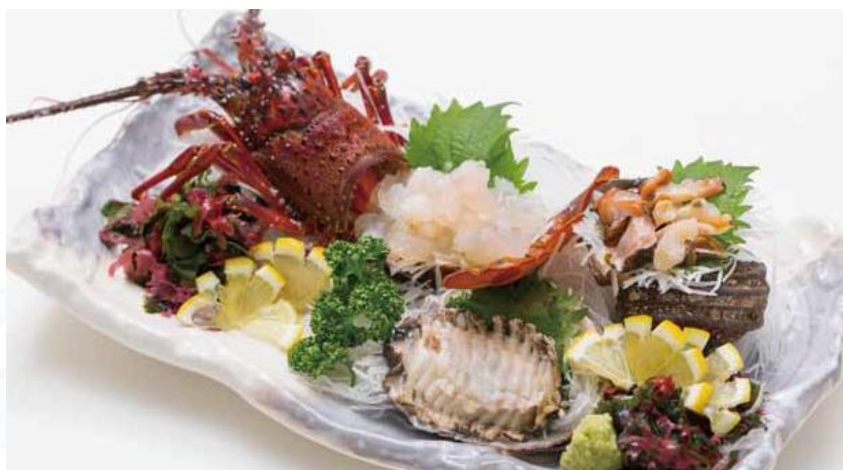
サザエ (刺身・壺焼き)