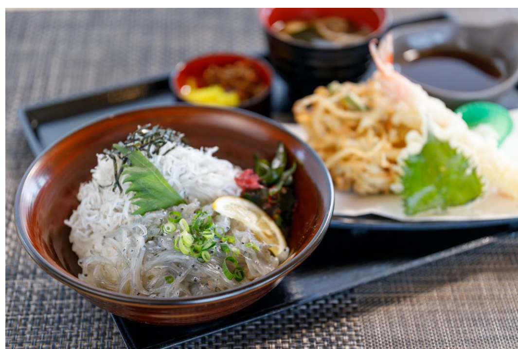
釜揚げ・生しらす2色御膳 ¥1,600