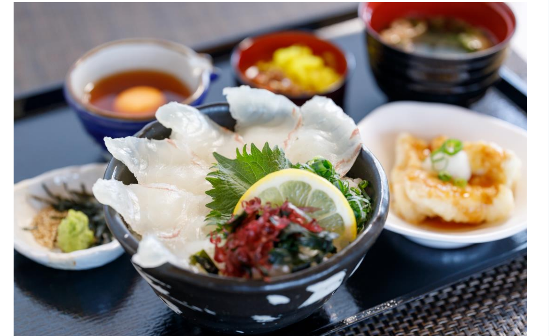
はなはな風鯛めし ¥1,300