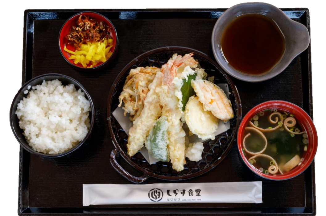
天ぷら定食 (並) ¥1,200