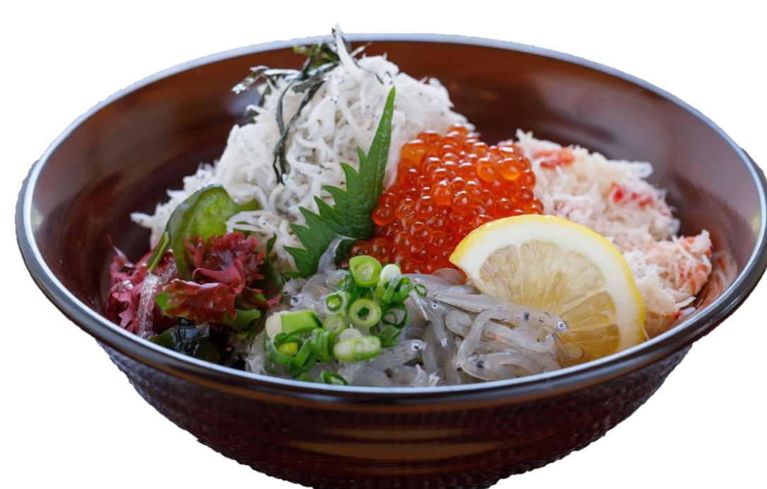
しらす・ずわい3色丼 ¥1,300