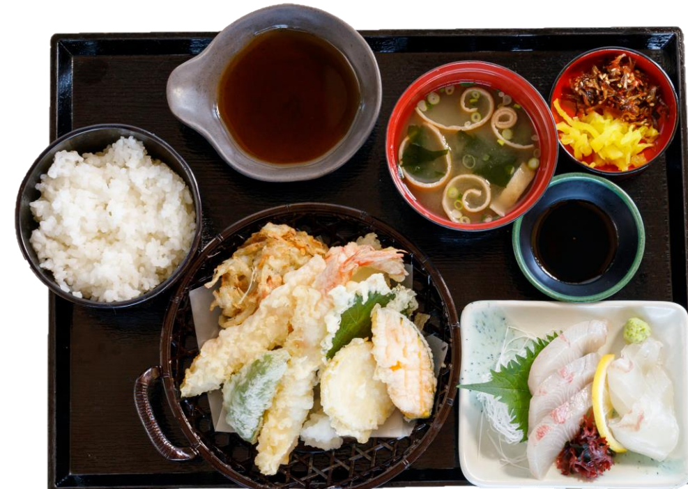
天ぷら定食 (上) ※刺身付き ¥1,600