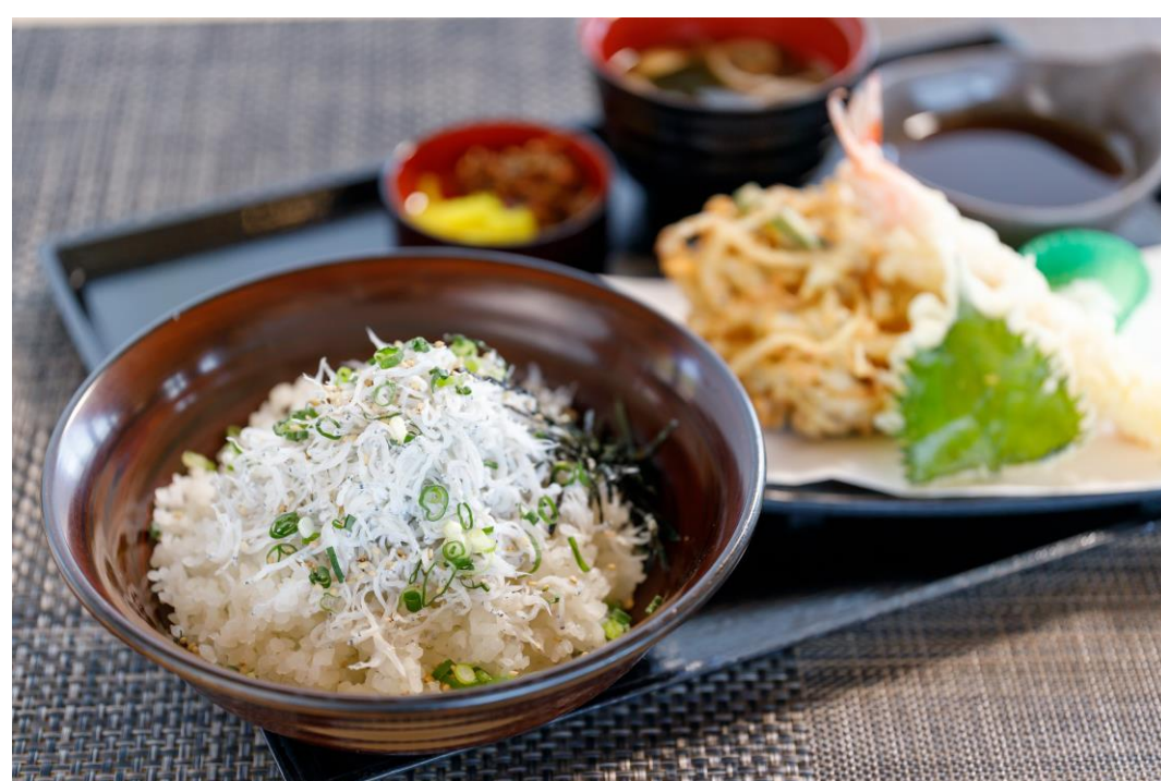
釜揚げしらす御膳 ¥1,300