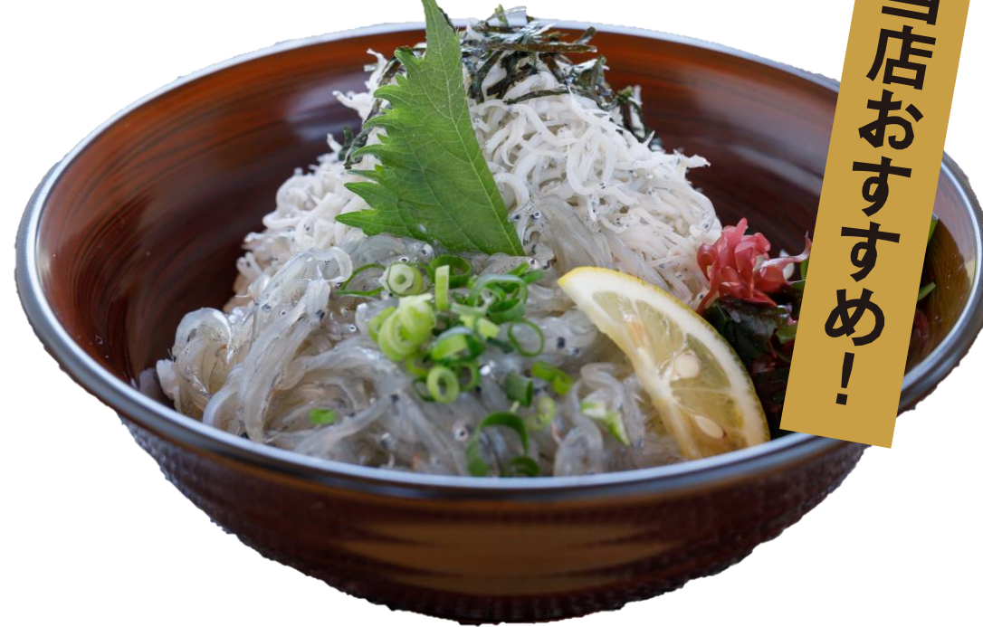
釜揚げ・生しらす2色丼 ¥1,100