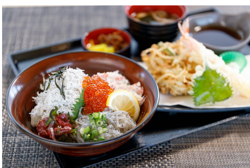
しらす・ずわい3色御膳 ¥1,800